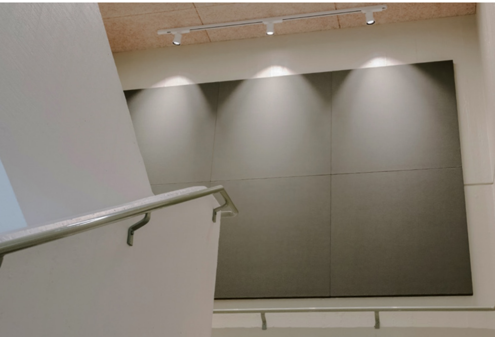
Projekt: Blågård Skole