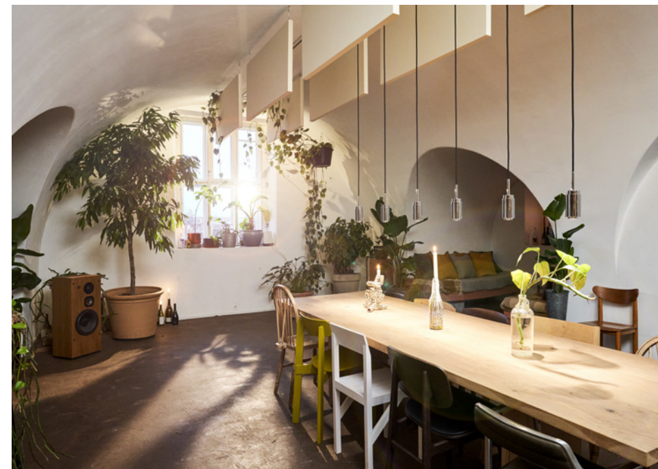
Projekt: Wonderland, kontor og eventlokale