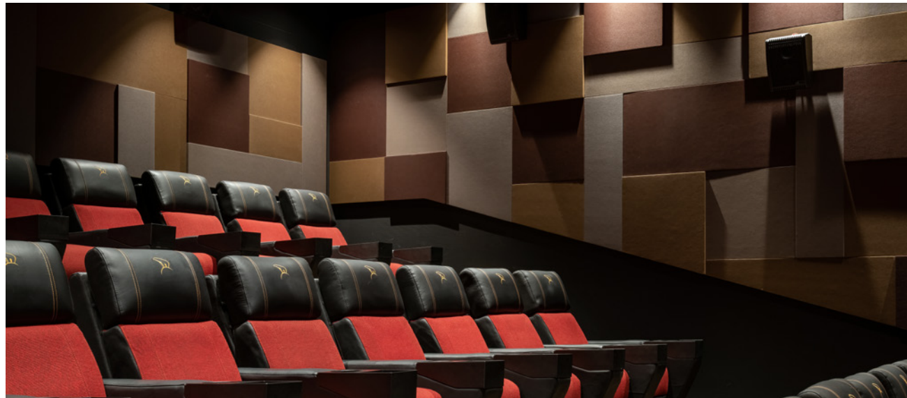
Projekt: Nordisk Film City 2