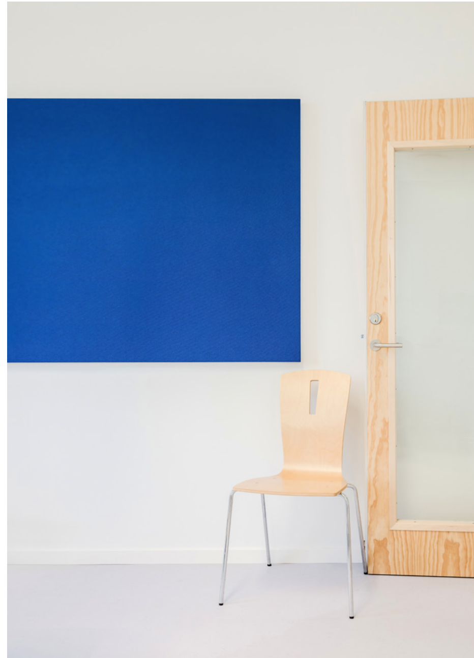
Projekt: Damhusengens Skole