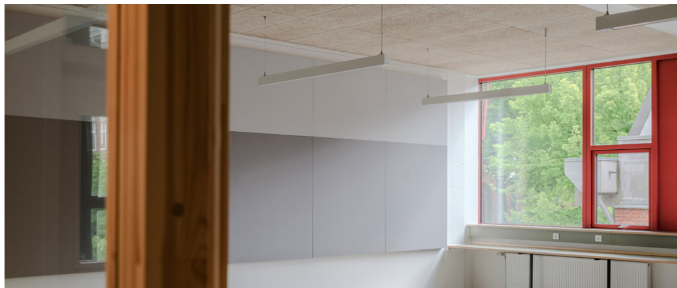
Projekt: Blågård Skole