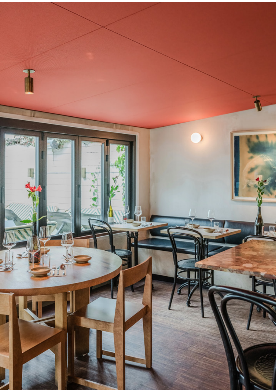
Projekt: Restaurant LAGO